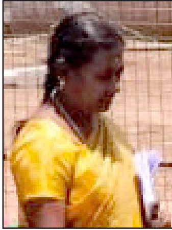
ஊராட்சி செயலாளர் கலா