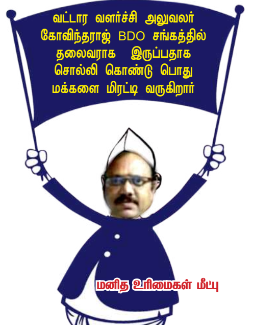
மனித உரிமைகள் மீயு

ஏற்கனவே உள்ள குடிநீர் ஆதாரங்களுடன், 2016-17 ம் ஆண்டில் 51,895 குடிநீர்