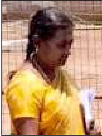
ஊராட்சி செயலாளர் கலா