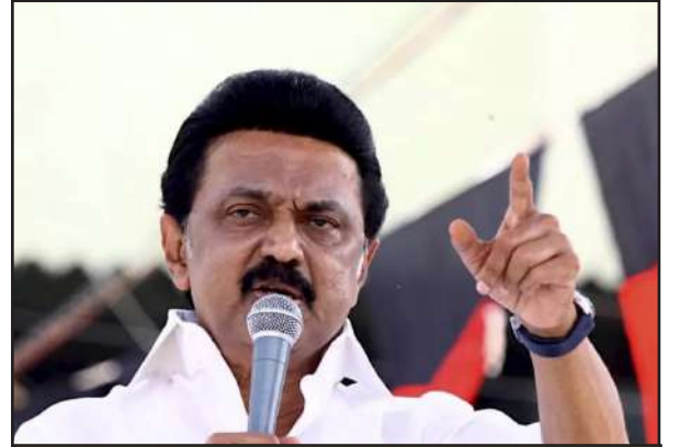
குழந்தைகள் மீதான பாலியல் வன்முறை தொடர்பாக முதல்வர் ஸ்டாலின் பேச்சு

பாலியல் தொல்லைகள், சீண்டல்கள் குறித்த புகார்கள் வந்ததும் உடனடியாக அரசு நடவடிக்கை எடுத்து வருகிறது. நீங்களே கடந்த சில நாட்களாக அதனைச் செய்திகளில் பார்த்துக்கொண்டு வருகிறீர்கள். உண்மைக் குற்றவாளிகள் யாராக இருந்தாலும் அவர்களைச் சட்டத்தின் முன் நிறுத்தப்பட்டு தண்டனை பெற்றுத் தர இந்த அரசு தயங்காது!